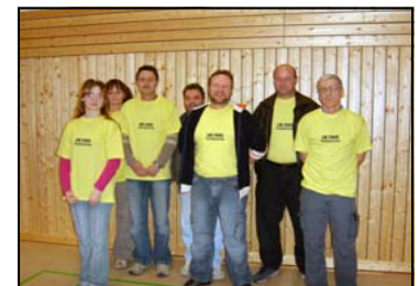
Tischbesetzung der LM